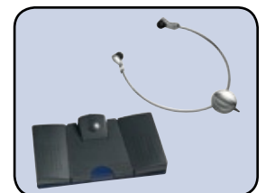
Kompatibel mit Grundig Business Systems-Fußschalter und -Kopfhörer