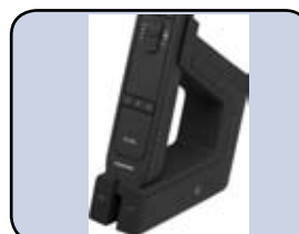
Inklusive Docking Station ...