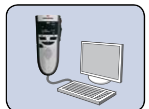
USB-Audio zum Diktieren am PC