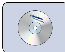
Inklusive Software DigtaSoft