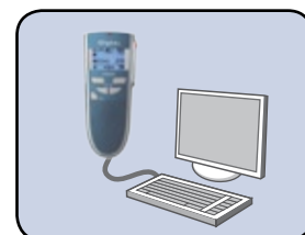
... USB-Audio zum Diktieren am PC