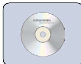
Inklusive Software ...