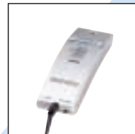
Mikrofon 276/10 Verwendung mit: Digital Desktop 9750