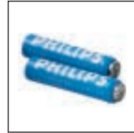
Wiederaufladbare Batterien 9144 Verwendung mit: Pocket Memo® 696 Digital Pocket Memos® 9350, 9250