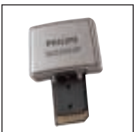
Barcode Scanner Modul 9284 Verwendung mit: Digital Pocket Memos® 9350, 9250. Ermöglicht das Verknüpfen von Diktaten mit anderen Dateien