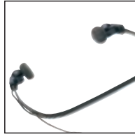
Kopfhörer 234 Verwendung mit: allen Philips Desktops