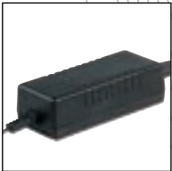
Netzteil 9145 Verwendung mit: Digital Pocket Memos® 9350, 9250, 9220