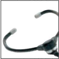
Kopfhörer 232 Verwendung mit: allen Philips Desktops