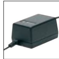
Netzteil 142 (UK) Verwendung mit: Pocket Memo® 388, 488, 588