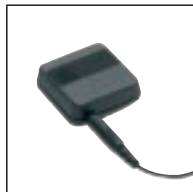
Konferenz-/Ansteckmikrofon 172 Verwendung mit: allen Philips Pocket Memos®, Desktops 725, 730, 9750