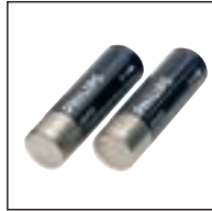
Wiederaufladbare Batterien 153 Verwendung mit: Pocket Memos® 388, 488