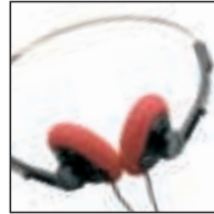
Kopfhörer 236 Verwendung mit: allen Philips Desktops