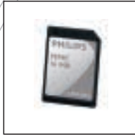
16 MB Multimedia Karte 9016 Verwendung mit: Philips Digital Pocket Memos® 9350, 9250 und Desktop 9750