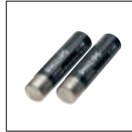
Wiederaufladbare Batterien 154 Verwendung mit: Pocket Memo® 588