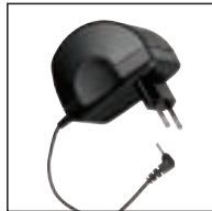
Netzteil 142 Verwendung mit: Pocket Memos® 388, 488, 588