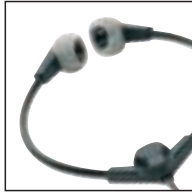
Kopfhörer 233 Verwendung mit: allen Philips Desktops