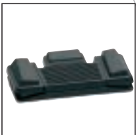
Fußschalter 210 Verwendung mit: allen Philips Desktops