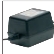
Netzteil 140 (UK) Verwendung mit: Pocket Memos® 696