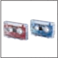
Mini Kassette 005 Mini Kassette 007 Verwendung mit: analogen Philips Pocket Memos® und Desktops

Alle von Philips entwickelten Zubehörteile werden speziell für die Benutzung mit Philips Diktiergeräten konzipiert. Die Produktion jedes Zubehörteils erfolgt nach den gleichen, sehr hohen Qualitäts-Standards und alle Zusatzausstattungen sind durch die Philips Garantiezusicherung abgedeckt. Zubehör von Philips – die einfachste Art und Weise, die hohen Leistungen Ihres Diktiersystems noch weiter zu verbessern.