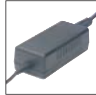
Netzteil 155 Verwendung mit: Desktops 720, 725, 730, 9750