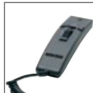
Mikrofon 276 Verwendung mit: Desktop 725, 730