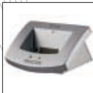
Tischladestation 9110 Verwendung mit: Digital Pocket Memos® 9350, 9250, 9220